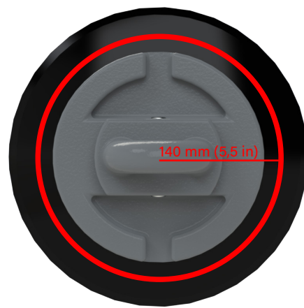
Catena a dischi CL2

Si consiglia di sostituire le catene a disco K4, CL1, W36 e R300 quando sono usurate fino alla parte inferiore del logo KELLY o a 125 mm (4,9 pollici) dal centro dei dischi. Per le catene a disco CL2 si consiglia la sostituzione quando sono usurate a 140 mm (5,5 pollici) dal centro dei dischi. Come è indicato dalla linea rossa nelle immagini.