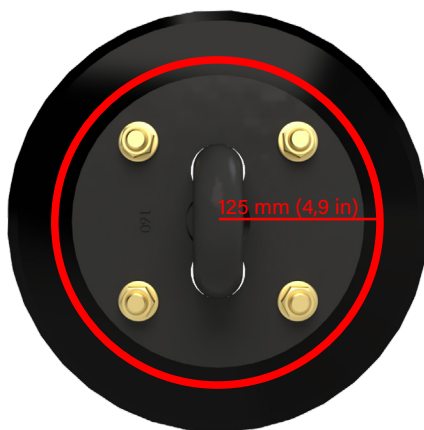
Catena a dischi K4