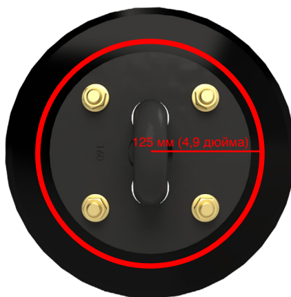
Ланцюг дисковий K4