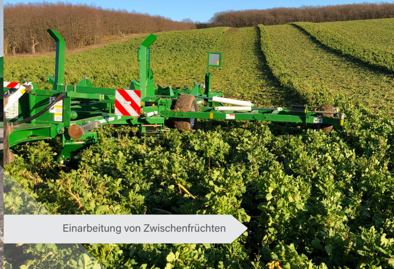
Einarbeitung von Zwischenfrüchten