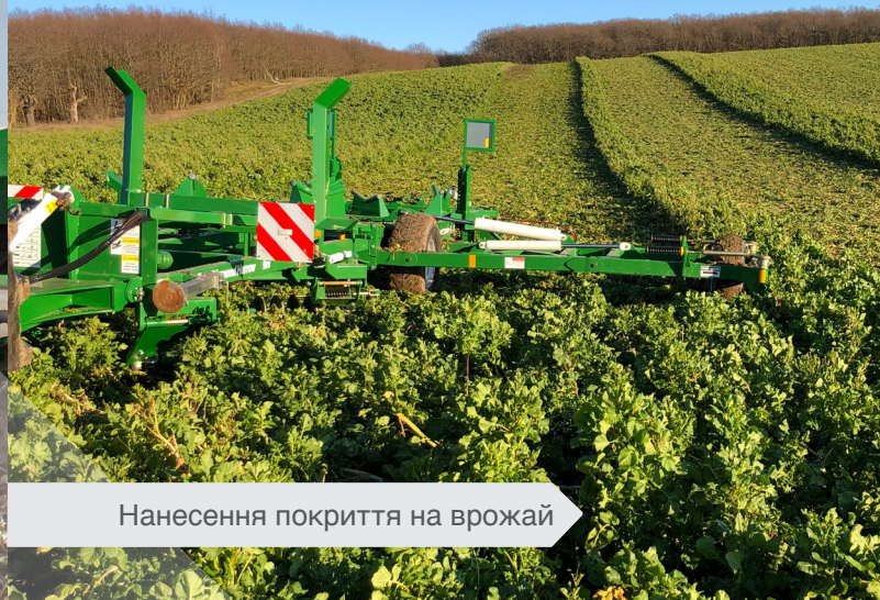
Нанесення покриття на врожай