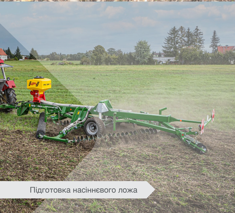
Підготовка насіннєвого ложа