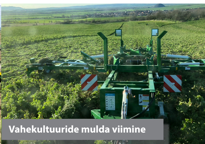
Vahekultuuride mulda viimine