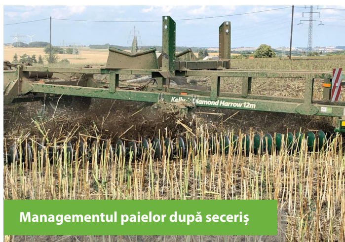
Managementul paielor după seceriș