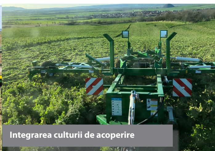
Integrarea culturii de acoperire