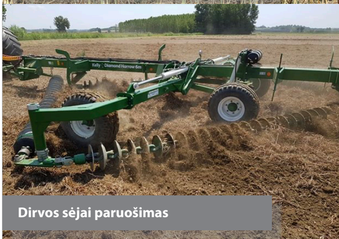
Dirvos sėjai paruošimas