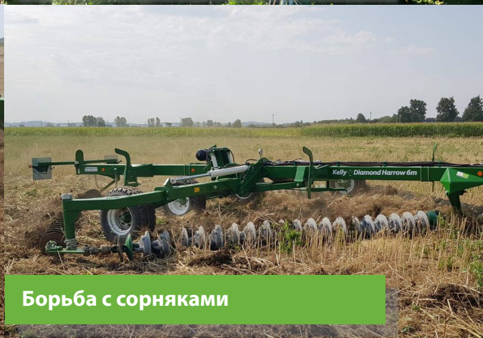
Борьба с сорняками

Независимо от решаемых задач, будь то борьба с огневкой кукурузной, удаление остатков, борьба с сорняками, сохранение влаги или создание идеального участка перед посевом, уникальная система обработки почвы Kelly ромбической формы обеспечивает возможность применения широкого ряда почвообрабатывающих дисков и цепей с шипами для удовлетворения круглогодичных потребностей фермерского хозяйства в легкой обработке почвы. Система обработки почвы Kelly — это идеальное орудие для