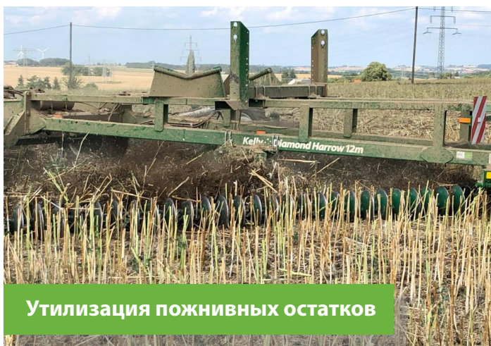
Утилизация пожнивных остатков