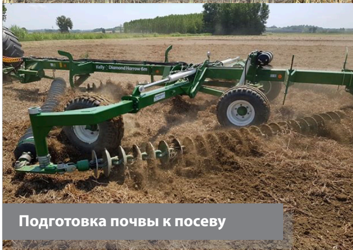
Подготовка почвы к посеву