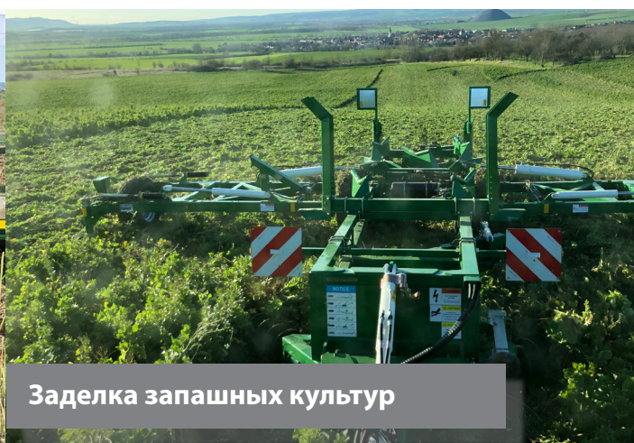
Заделка запарных культур