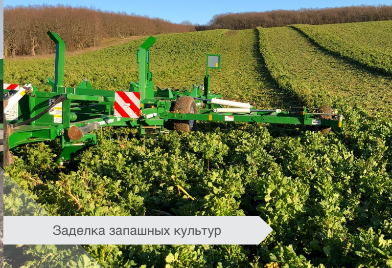
Заделка запашных культур