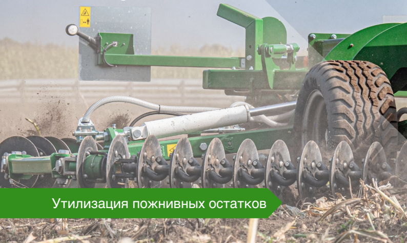
Утилизация пожнивных остатков