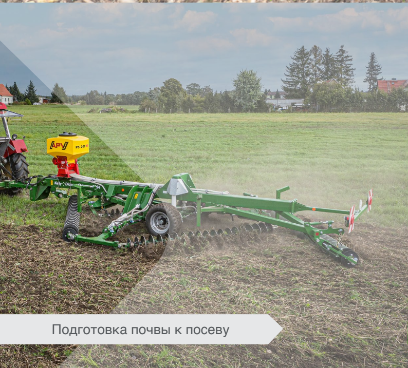
Подготовка почвы к посеву