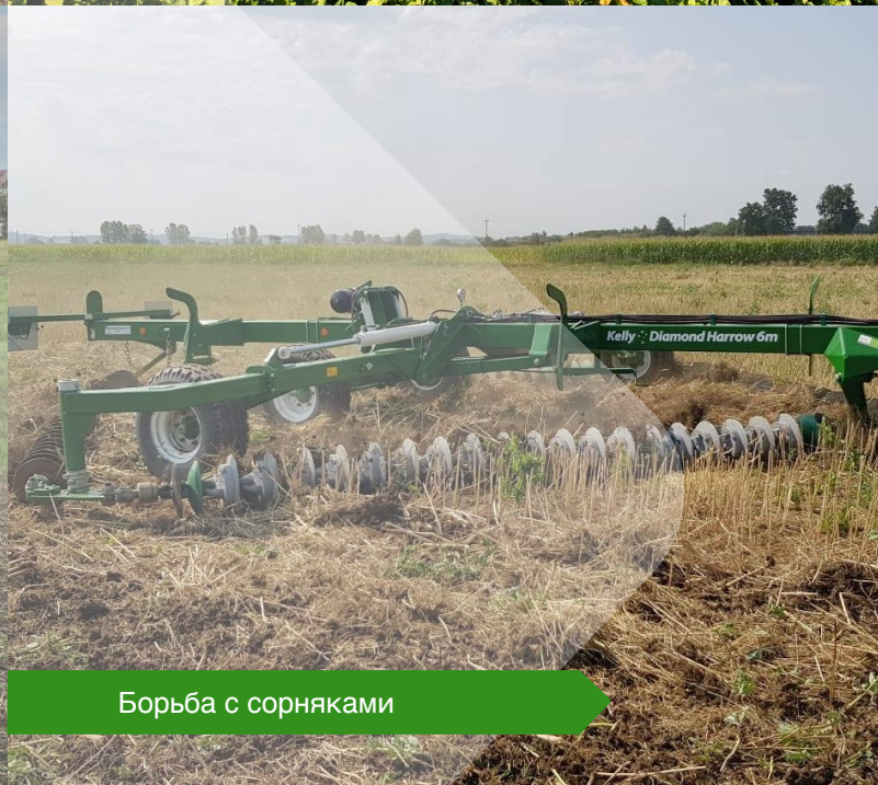
Борьба с сорняками