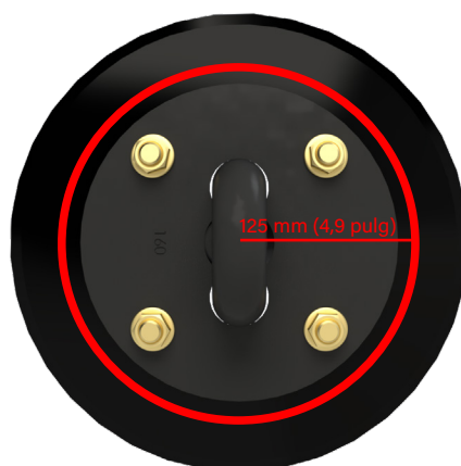
Cadena de Discos K4