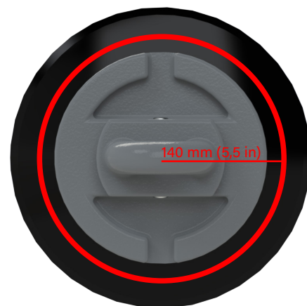
CL2 Diska Ķēde

Mēs iesakām nomainīt K4, CL1, W36 un R300 disku ķēdes, ja tās ir nolietotas līdz KELLY logotipa apakšai vai 125 mm (4,9 collas) no disku centra. Mēs iesakām nomainīt CL2 disku ķēdes, kad tās ir nodilušas līdz 140 mm (5,5 collas) no disku centra. Kā norāda sarkanā līnija attēlos.