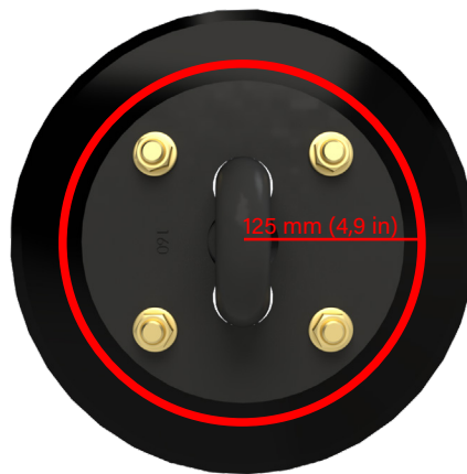
K4 Disc Ketting