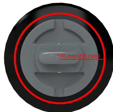
Łańcuch tarczowy CL2

Zalecamy wymianę łańcuchów tarcz K4, CL1, W36 i R300, gdy są zużyte do dolnej krawędzi logo KELLY lub 125 mm (4,9 cala) od środka tarcz. W przypadku łańcuchów do tarcz CL2 zalecamy wymianę, gdy są zużyte do 140 mm (5,5 cala) od środka tarcz. Jak wskazuje czerwona linia na zdjęciach.