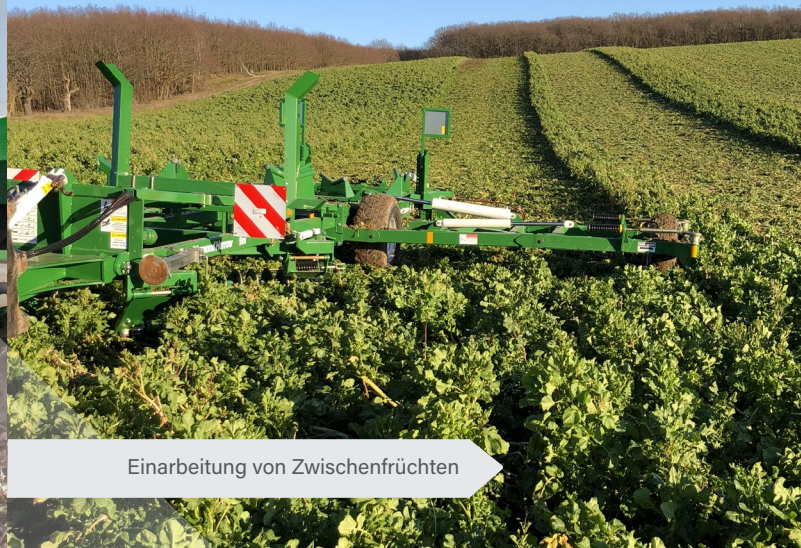
Einarbeitung von Zwischenfrüchten