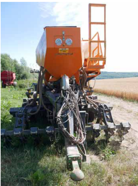
Die Drillmaschine von Mzuri aus England von vorne. Sie wird per Deichsel an die Kugelkopfkupplung gekoppelt und gezogen.