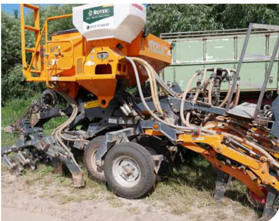
Der Haupttank der Sämaschine ist zweigeteilt, sodass bei der Saat auch Unterfußdünger ausgebracht werden kann. Zudem befindet sich ein zusätzlicher kleiner weißer Saatgutkasten auf der Maschine. Der weiße Tank wurde nachgerüstet, ist inzwischen aber auch serienmäßig erhältlich. Thinus Glitz bringt damit Schneckenkorn bei der Rapssaat aus, es lassen sich aber auch Feinisaaten als weiteres Saatgut ausbringen.

Beim Mzuri-System wird der Boden zu zwei Dritteln nicht mechanisch bearbeitet. Jedem Lockerungszinken mit 37 cm Abstand läuft ein Wellsech voraus, das die Ernterückstände schneidet. Eine streifenweise tiefe Bodenlockerung, ohne den Boden zu mischen, wird mit der Direktsaat kombiniert. Die Tiefenlockerungszinken heben den Boden in Streifen an. Zugleich kann auch Dünger ausgebracht werden. Die Ernterückstände werden in Dämmen auf der nichtbearbeiteten Fläche abgelegt. Das Maschinengewicht wird durch einen zweireihigen Reifenpacker, mit einem Reifen je Reihe, zur Rückverfestigung verteilt. Die Säschar arbeiten unabhängig von den vorlaufenden Lockerungsscharen. Jedes Schar ist über eine Andruckrolle tiefengeführt, über ein Hydrauliksystem lässt sich der Druck auf das Andruckrad entsprechend den Bodenverhältnissen einstellen.