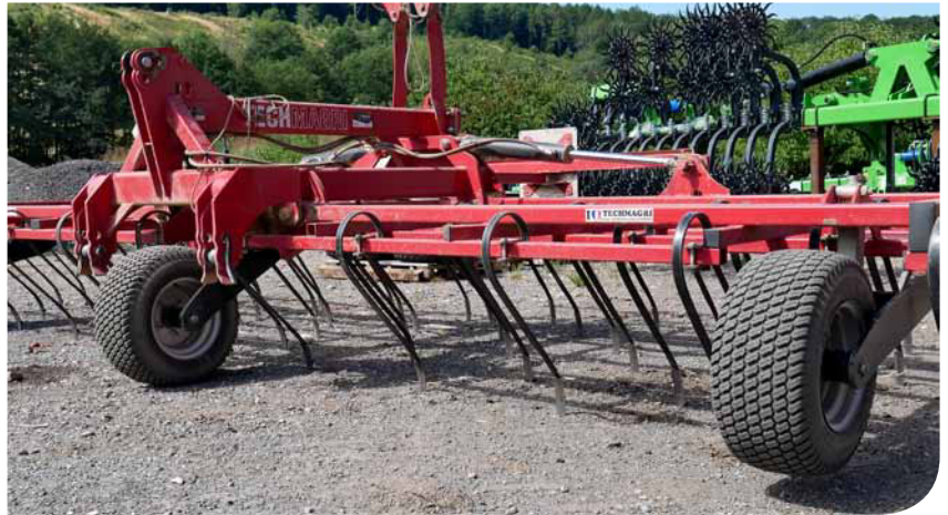
Das Saatgut wird mit hydraulisch in der Tiefe verstellbaren Zinken im Boden abgelegt.