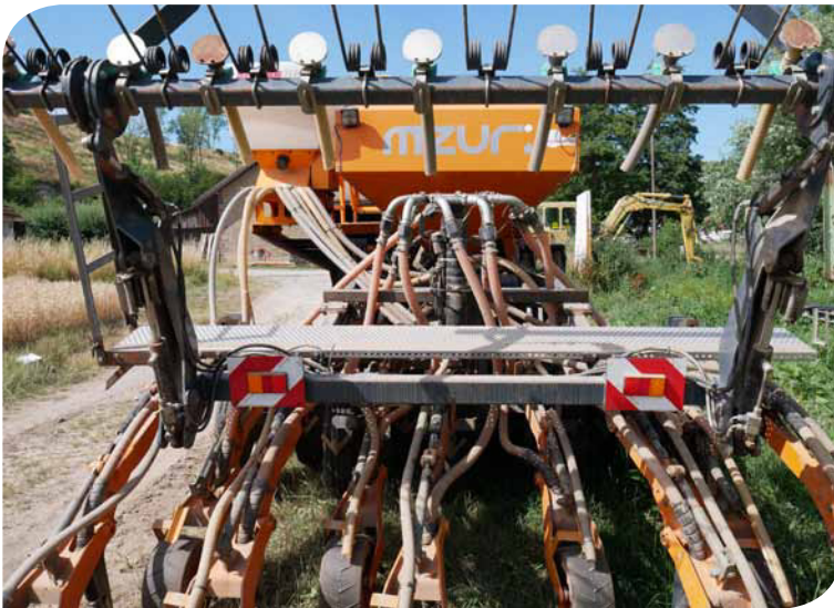
Hinter jedem Säschar läuft eine Andruckrolle. Über den Andruckrollen enden Schläuche, über die Schneckenkorn, aber auch Feinisaaten ausgebracht werden können.